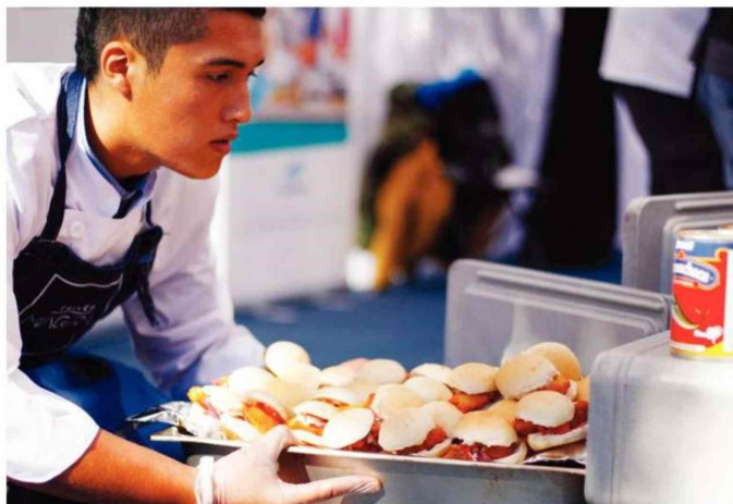
EL PÚBLICO PUDO APRENDER Y SABOREAR LAS RICAS RECETAS DE LOS CHEF.